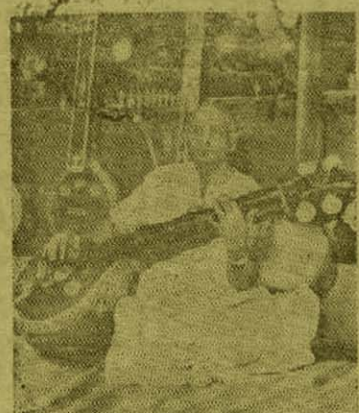
வாசித்து கர்நாடக இசை உலகுக்கு வழங்கியது குறிப்பிடத்தக்கது.

நாடு முழுவதும் கச்சேரிகள் செய்தார். பல முறை வெளி நாடுகள் சென்று வீணை நிகழ்ச்சிகள் நடத்தினார். வெளிநாடுகளில் இவருக்கு ஏராளமான ரசிகர்கள் உள்ளனர். கர்நாடக இசை நீண்ட நேர இசைத்தட்டுகளில் LP அதிகம் வாசித்தவர் இவரே 25 இசைத்தட்டுகள் வெளி வந்துள்ளன இதில் இவர் வெங்கடமகியின 72 மேள கந்தரா ராகங்களை 12 நீண்ட இசைத் தட்டுகளில்